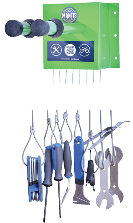
UNIOR velosipēdu instrumenti

Iekārta nav brīvi stāvoša. Iekārta tiek nostiprināta, to montējot ar skrūvēm pie sienas.