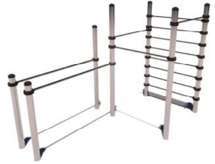
Priekšpuse Front view Aizmugure Back view